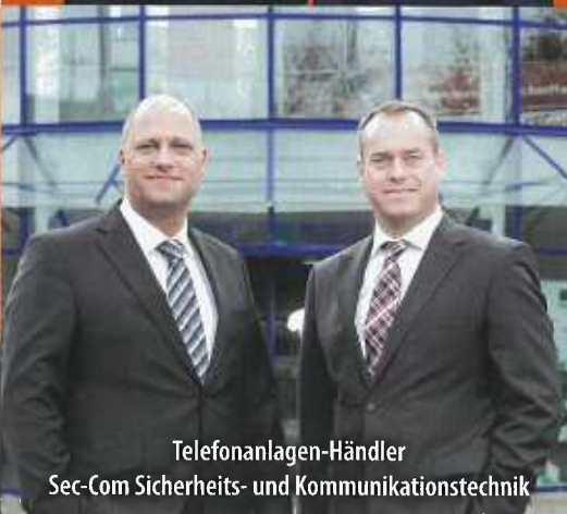
Telefonanlagen-Händler Sec-Com Sicherheits- und Kommunikationstechnik