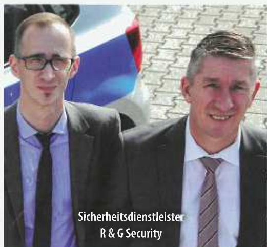
Sicherheitsdienstleister R & G Security