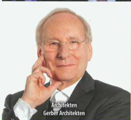
Architekten Gerber Architekten