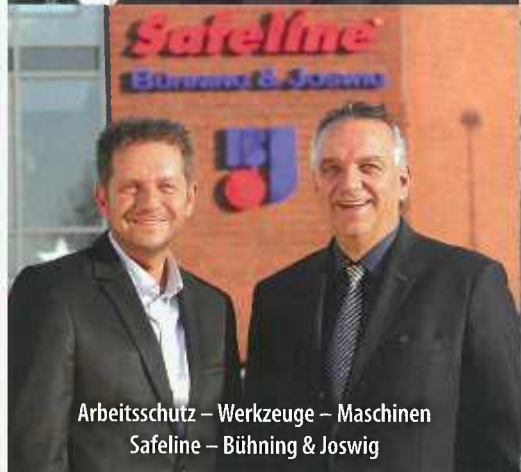
Arbeitsschutz – Werkzeuge – Maschinen Safeline – Bühning & Joswig