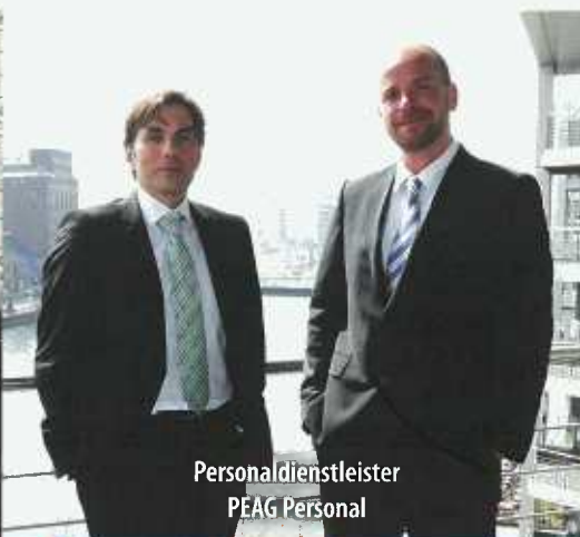
Personaldienstleister PEAG Personal